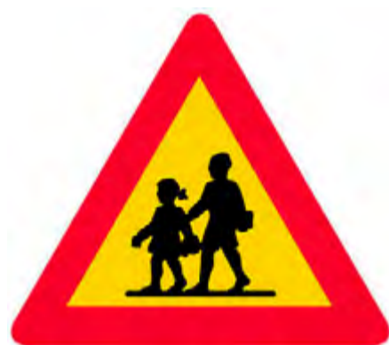
Συχνή χρήση του δρόμου από παιδιά