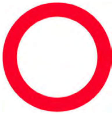
Κλειστή οδός για όλα τα οχήματα και προς τις δύο κατευθύνσεις