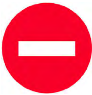
Απαγορεύεται η είσοδος σε όλα τα οχήματα