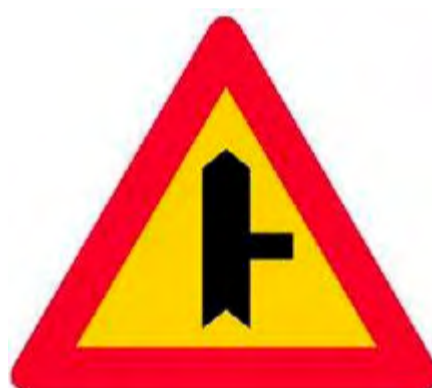
Διακλάδωση με κάθετη οδό δεξιά