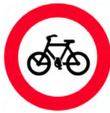
Απαγορεύεται η είσοδος στα ποδήλατα