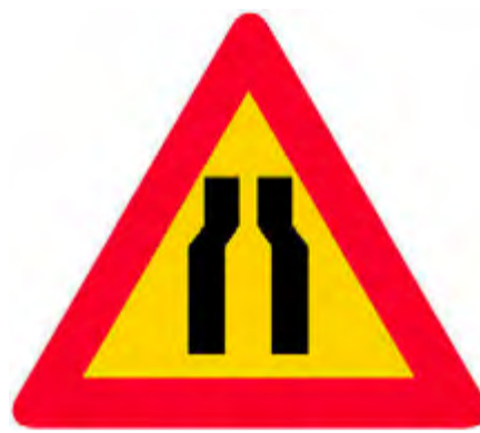
Ο δρόμος στενεύει και από τις δυο πλευρές