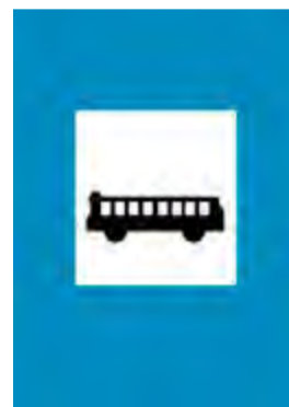
Στάση λεωφορείου ή τρόλεϊ