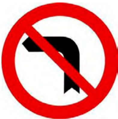
Απαγορεύεται η αριστερή στροφή