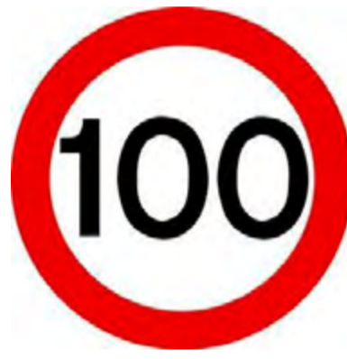
Η μέγιστη ταχύτητα περιορίζε- ται στον αναγραφόμενο αριθ- μό (π.χ. 100) χλμ. την ώρα