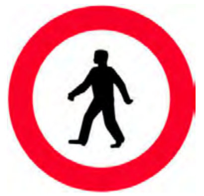
Απαγορεύεται η είσοδος σε πεζούς