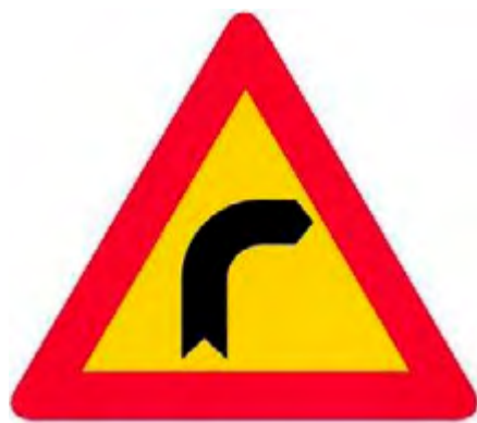
Επικίνδυνη στροφή προς τα δεξιά