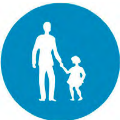
Οδός υποχρεωτικής διέλευσης πεζών