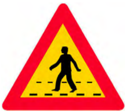
Κίνδυνος λόγω διάβασης πεζών