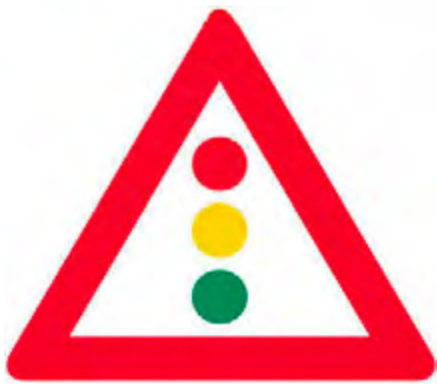
Κόμβος ή θέση όπου η κυκλοφορία ρυθμίζεται με τρίχρωμη φωτεινή σηματοδότηση