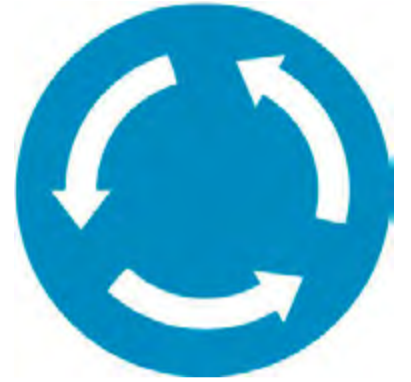
Κυκλική υποχρεωτική διαδρομή