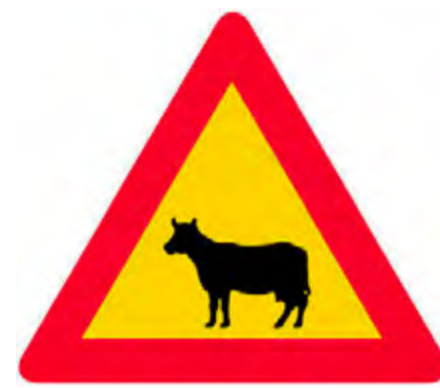
Κίνδυνος από διέλευση οικόσιτων ζώων