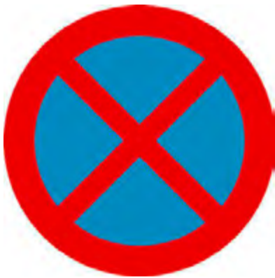
Απαγορεύεται η στάση και η στάθμευση