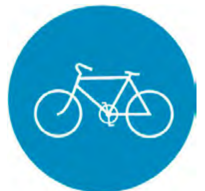
Οδός υποχρεωτικής διέλευσης ποδηλάτων