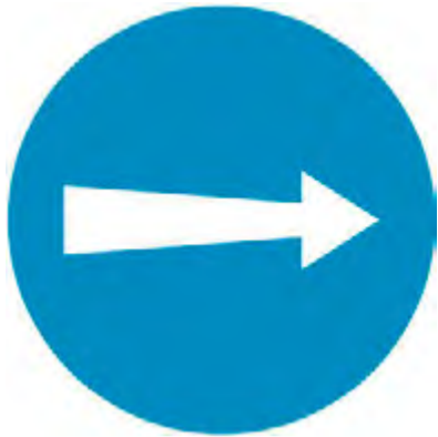
Υποχρεωτική κατεύθυνση πορείας προς τα δεξιά