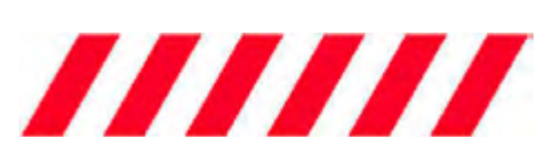
Εμπόδιο κινητό, λόγω έργων επί της οδού