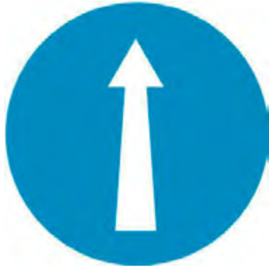
Υποχρεωτική κατεύθυνση πορείας προς τα εμπρός