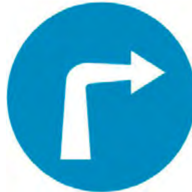
Προαιρετική κατεύθυνση πορείας με στροφή δεξιά