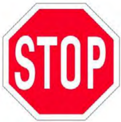
Υποχρεωτική διακοπή πορείας