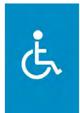
Άτομα με μειωμένη κινητικότητα