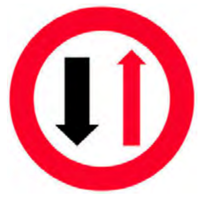
Προτεραιότητα της αντιθέτως ερχόμενης κυκλοφορίας λόγω στενότητας του οδοστρώματος