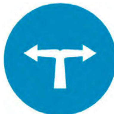
Υποχρεωτική κατεύθυνση πορείας με στροφή αριστερά ή δεξιά