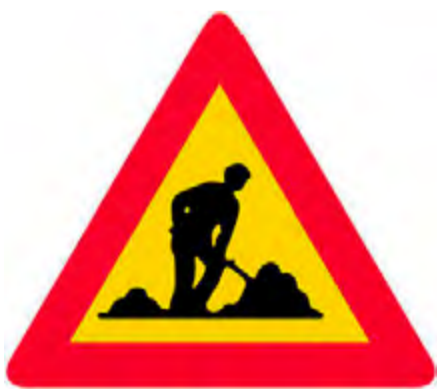
Κίνδυνος λόγω εκτελούμενων εργασιών στο οδόστρωμα