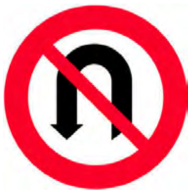
Απαγορεύεται η αναστροφή