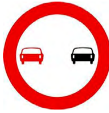
Απαγορεύεται το προσπέρασμα των μηχανοκίνητων οχημάτων