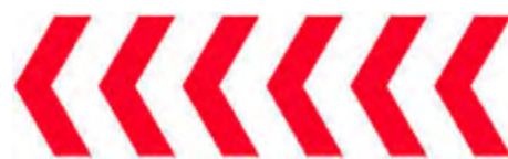
Κατεύθυνση επισήμανσης επικίνδυνων καμπυλών