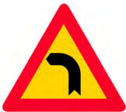
Επικίνδυνη στροφή προς τα αριστερά