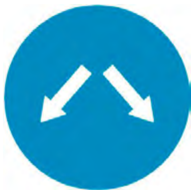
Υποχρεωτική διέλευση είτε από τη δεξιά είτε από την αριστερή πλευρά της νησίδας ή του εμποδίου